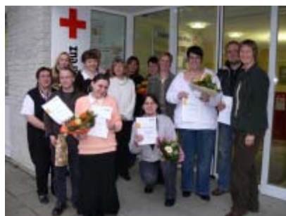
Die erfolgreichen Teilnehmer der Pflegeassistentenausbildung nebst Ausbilderinnen.

Zusätzlich wurden 10 Mitarbeiter/Innen in einer 144-stündigen Schulung zu Pflegeassistenten ausgebildet. Hierdurch wird die Qualität unserer Pflege weiter erhöht.