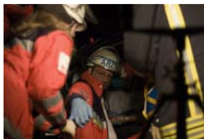
Rettungsdienst im Einsatz

hochwertige Transporte durchgeführt. Hierzu zählen Inkubatortransporte immer dann, wenn das Kinderintensivmobil der Berufsfeuerwehr Bielefeld bereits im Einsatz ist oder Infektionstransporte kritisch Kranker. Einen besonderen Schwerpunkt des Notfallkrankentransportwagens bilden die Intensivverlegungen, bei denen der Patient zumeist umfangreich überwacht werden muss. Vielfach handelt es sich um kardiologische Patienten, denen ein operativer Eingriff am Herzen in den Zentren Bad Oeynhausen oder Bad Rothenfelde bevorsteht. Darüber hinaus ist der Notfallkrankentransportwagen aber auch zur Spitzenabdeckung bei Notfallrettungseinsätzen im Einsatz.