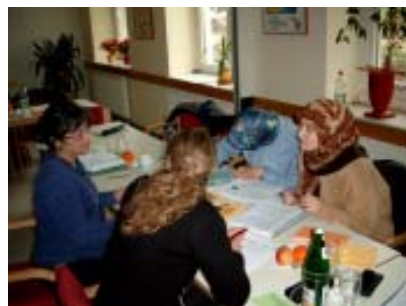
Teilnehmer/innen des MiMi- Projekts

Dort wurden die für Eltern interessanten Themen in Form einer Informationsreihe angeboten. In der DRK Kita Weltweit wurde die erste Veranstaltungsreihe mit 7 Veranstaltungen durch eine Mediatorin durchgeführt. Um zukünftig Familienzentren, Frauensprachkurse und andere Institutionen verstärkt ansprechen zu können, wurde ein Flyer für Bielefeld entwickelt. Im Jahr 2006 wurden 18 muttersprachige Veranstaltungen zu unterschiedlichen Gesundheitsthemen durchgeführt. Die Sprecherin der Mediatorinnen organisierte 3 mal den so genannten „Stammtisch“, in dem sich die Mediatoren/innen austauschen und ihre Kampagnen reflektieren können. Die Vorbereitungen und Absprachen hierfür finden jeweils mit der DRK MEB Beraterin statt.