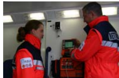
Ausbildung im RTW

Nunmehr sind alle in und mit der ASB DRK JUH Rettungsdienst Bielefeld gGmbH arbeitenden nebenamtlichen Mitarbeiterinnen aus den Rotkreuzgemeinschaften dazu aufgerufen, das Verbesserungspotenzial in Form von Verbesserungsvorschlägen einzubringen.