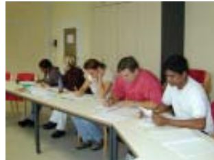
Teilnehmer aus verschiedenen Ländern im Deutschkurs

Das Bildungswerk musste im Jahr 2006 einen Rückgang der Unterrichtsstundenzahl i.H.v. 14 % verzeichnen. Besonders betroffen war die Kurssparte „Deutsch als Fremdsprache II, Kurse für Arbeitpluskunden“. Demgegenüber konnte der Bereich „Deutsch als Fremdsprache III, Integrationskurse“ deutlich gesteigert werden.