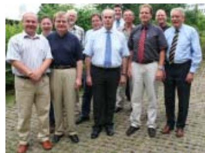
Die „Gründerväter“ der DRK OWL Soziales Wohnen gGmbH

Weitere Vorhaben sollen dann in Lemgo und Herford angegangen werden.