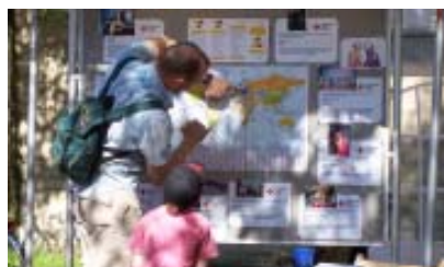
Neuorientierung in Bielefeld

Aufgabe der Clearingstelle ist es, Neuzuwanderer auf die angebotenen Integrationskurse und die Begleitung des Integrationsprozesses durch die MEB bzw. für junge Neuzuwanderer (16 – 27 Jahre) durch die spezifischen Jugendintegrationskurse und den Jugendmigrationsdienst hinzuweisen.