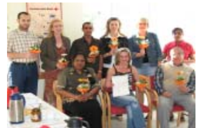
Abschluß eines Integrationskurses