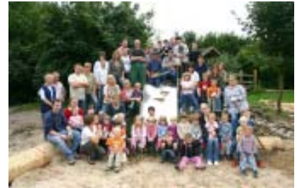
Die Freiwilligen bei der Gesattung des Außengeländes

Nun können die Kinder nicht nur besser klettern, wippen, schaukeln, sondern auch mit Wasser und Sand matschen.