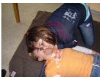
PIA Kinder beim Erste-Hilfe Kurs

Besonders Migranten/innen sind angesprochen in diesem Projekt mitzuarbeiten. Die Mitwirkenden sollen einander helfen, Probleme zu lösen, sich gegeneinander zu stärken und zu unterstützen. Dazu gehört auch, den Stadtteil Heideblümchen, in dem sie leben, gemeinsam zu gestalten.