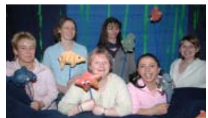
Eltern bei der Theaterrückführung „Geschichte vom Regenbogenfisch“

Auch bei Festen und öffentlichen Veranstaltungen waren Eltern gemeinsam mit Erzieherinnen und Kindern aktiv.