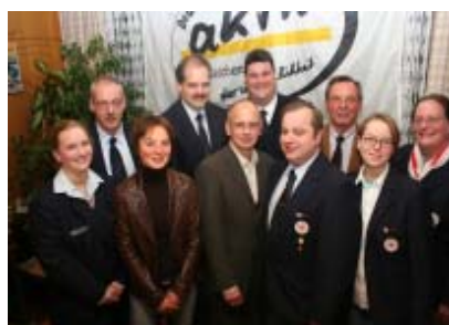
Der Kreisvorstand, v. l.: