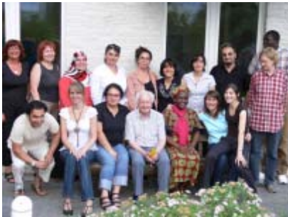
Projektmitarbeiterinnen und Teilnehmer/innen des MediaTas

Begleitung der MEB durch die Vermittlung von Paten, die Organisation von Gruppenangeboten und spezifische Beratung in Suchtfragen.