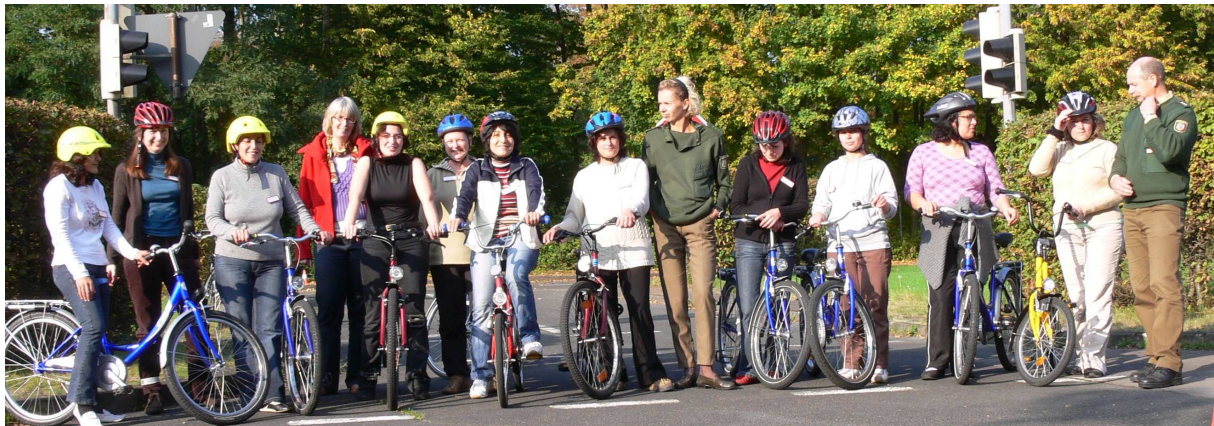
Gruppenbild der Teilnehmerinnen mit Lehrern