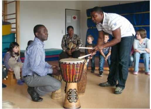
Brong Ahaf Union musiziert in der DRK Kita Heideblümchen