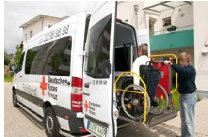
Der Fahrdienst in Aktion, beim Einladen eines Rollstuhlfahrers in eines der Spezialfahrzeuge des Fuhrparks.

Die von der neuen Koalition angedachte Verkürzung des Wehrdienstes auf sechs Monate hätte aus Gründen der „Wehrgerechtigkeit“ auch eine Verkürzung des Zivildienstes zur Folge. „Allein im Deutschen Roten Kreuz in Westfalen-Lippe erbringen jährlich ca. 400 junge Menschen mit ihrem Zivildienst wichtige Hilfeleistungen für das Gemeinwohl, zum Beispiel in der Sozialen Arbeit oder im Rettungsdienst“, so Ludger Jutkeit, Vorstand des DRK-Landesverbandes Westfalen-Lippe. Es gelte die schwerwiegenden Folgen bei der geplanten Kürzung zu bedenken. Eine Verkürzung der Zivildienstzeit auf ein halbes Jahr würde sich nicht nur negativ auf die Leistungsfähigkeit, sondern auch auf die Attraktivität des Zivildienstes auswirken. Schließlich sei der Zivildienst ein sozialer Lerndienst, der jungen Menschen bei ihrer beruflichen Orientierung helfen kann. „Darüber hinaus benötigen wir Zeit, um die Zivildienstleistenden einzuarbeiten und zu qualifizieren“, so Jutkeit. Diese wäre bei einer weiteren Verkürzung nicht mehr vorhanden.