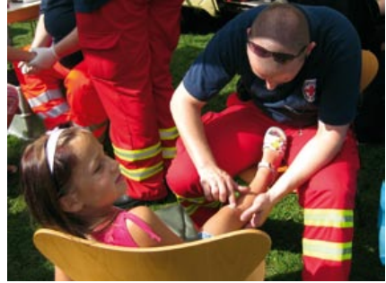
Noch ist das Knie heil

wurde zwar großzügig mit „Blut“ umgegangen, die Wunden aber nicht deckungsfrei an die Haut angepasst. Unbeteiligten, Rettungspersonal oder Eltern sollte dadurch Aufregung erspart werden.