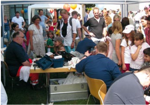
Starker Andrang beim Schminkteam

Auf Anfrage des historischen Museums der Stadt Bielefeld beteiligte sich der DRK Ortsverein Bielefeld-Dornberg e.V. mit seinem Arbeitskreis Realistische Unfalldarstellung (RUD) in diesem Jahr erstmalig beim Kinderfest Wackelpeter im Ravensberger Park.